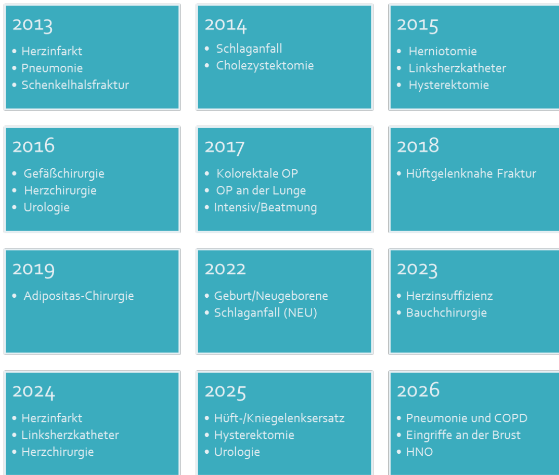
Abbildung 1: Überblick Jahresschwerpunkte im A-IQI Projekt

Das Peer-Review-Verfahren ist das Analyseinstrument in A-IQI. Es handelt sich hierbei um ein strukturiertes systematisches Verfahren basierend auf einer retrospektiven Krankengeschichtenanalyse. Grundvoraussetzung ist ein vertrauensvolles Umfeld. Es funktioniert nach dem Prinzip der Gegenseitigkeit mit direktem Austausch von Wissen. Der Fokus im Verfahren liegt auf dem Finden von Lösungen.